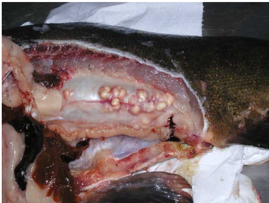
Figura 3. Vescica natatoria di tinca con formazioni nodulari