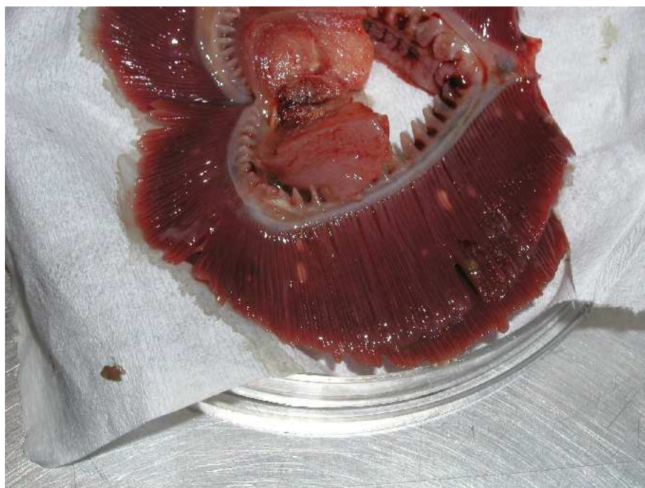
Figura 2. Branchie di tinca: formazioni cistiche interlamellari

celomatica si rinvenivano formazioni nodulari biancastre, delle dimensioni di un pisello, disseminate su vescica natatoria e peritoneo (Figure 3 e 4).